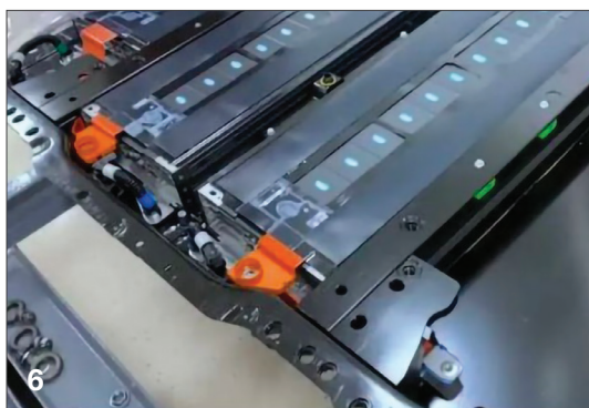
Immagine di copertina per concessione di FAAM