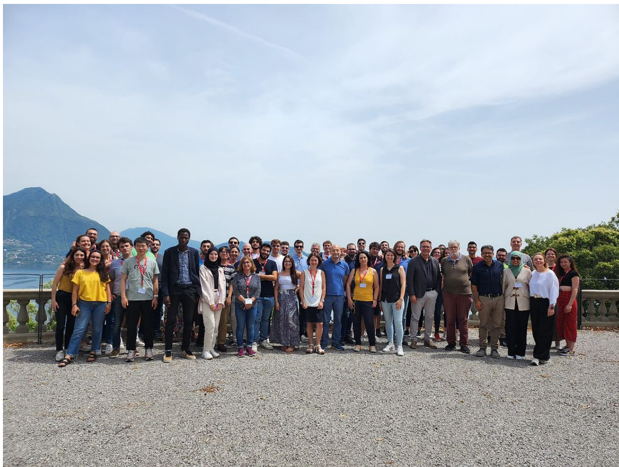
Partecipanti alla Scuola di Chimica Fisica 2023