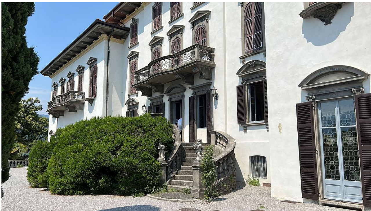
Sede della Scuola di Chimica Fisica 2023

Si è conclusa con successo la scuola di Chimica Fisica 2023 dedicata ai nanomateriali e nanostrutture. Ricercatori di alto profilo internazionale hanno approfondito aspetti di sintesi, caratterizzazione avanzata e nuove applicazioni dei nanomateriali (qui sotto alcune foto dell'evento).