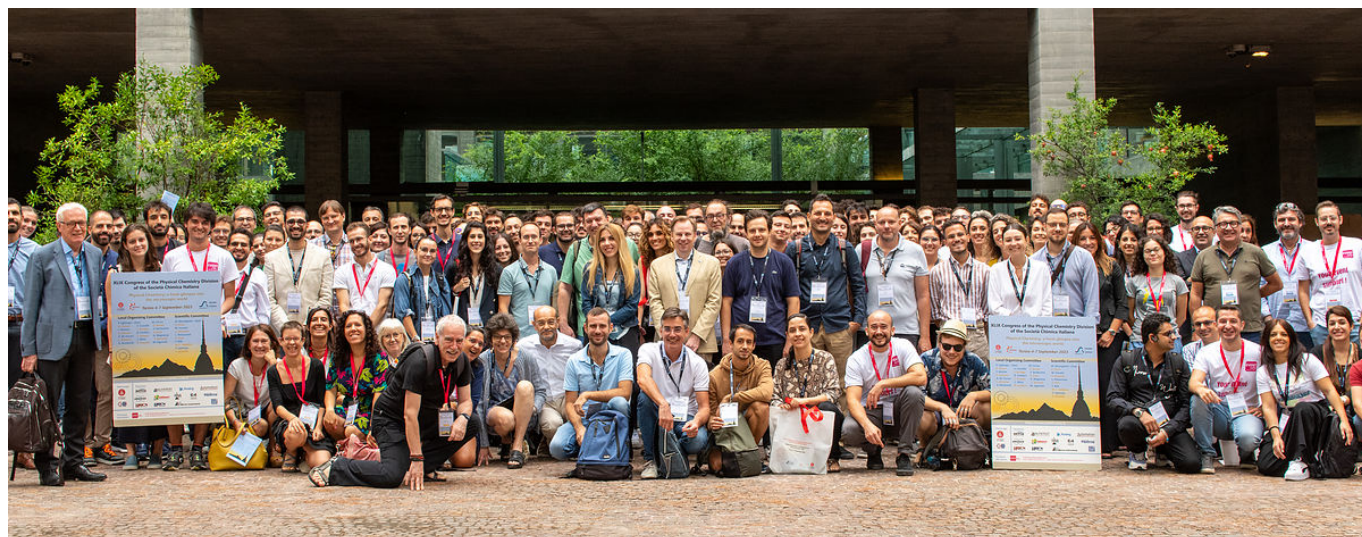
Partecipanti al Congresso di Chimica Fisica di Torino 2023