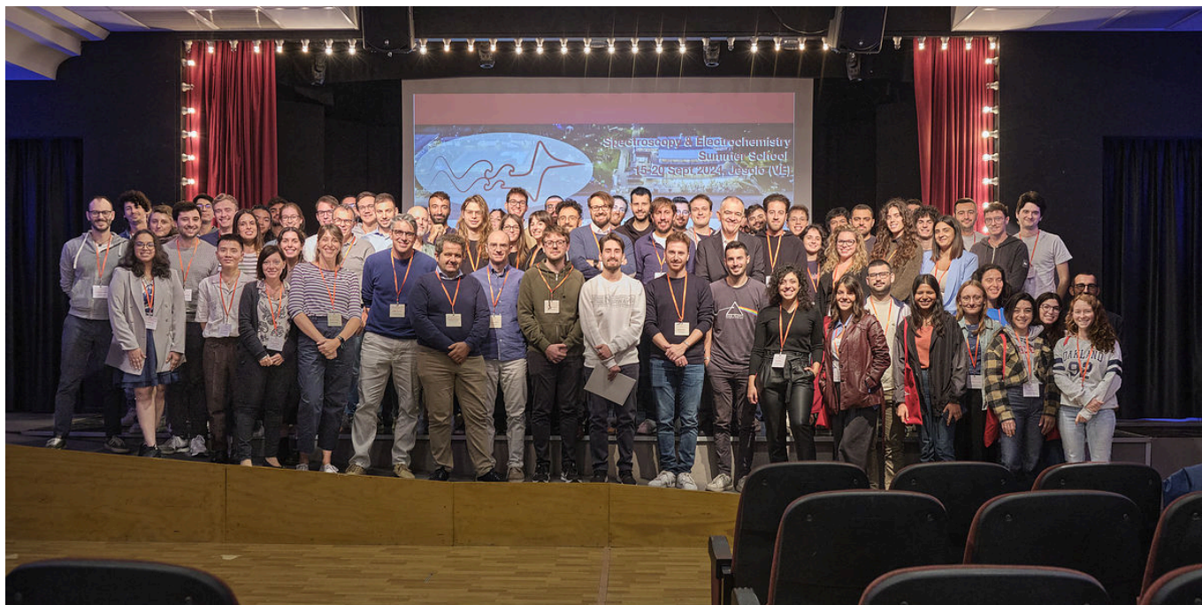
Partecipanti alla scuola 'Spectroscopy and Electrochemistry Summer School' (SPEC2024)

sito web: https://www.disc.chimica.unipd.it/spec_school [16]