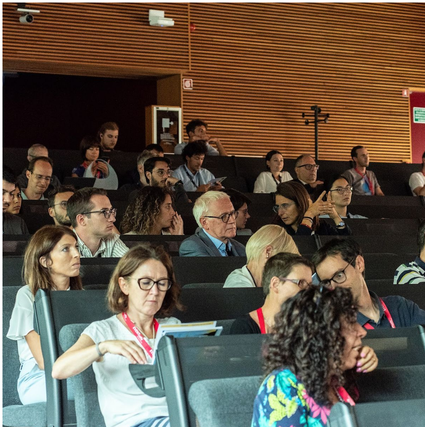
Alcuni partecipanti durante una sessione dei lavori del Congresso nella Sala Darwin