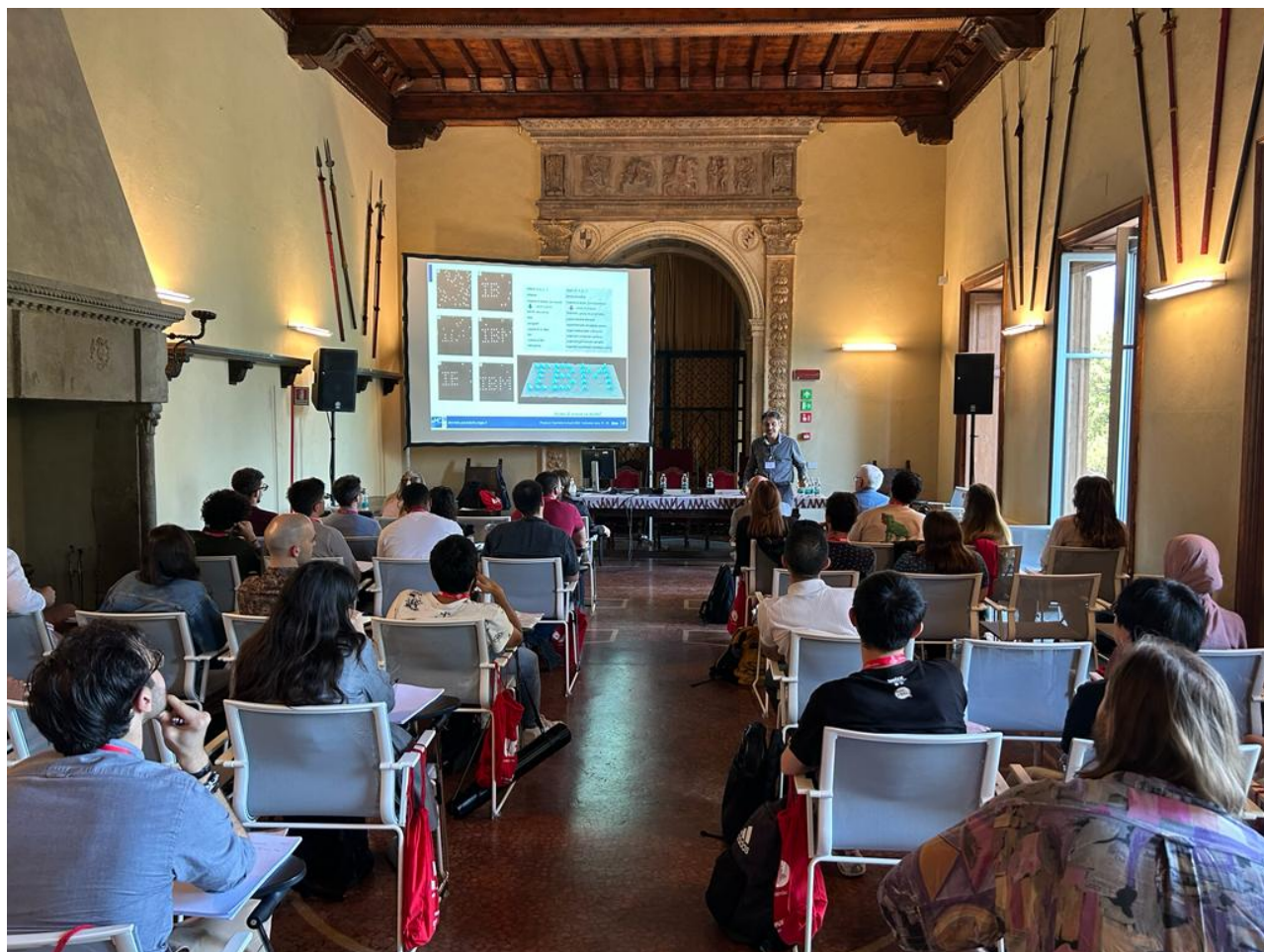
Una sessione dei lavori della Scuola di Chimica Fisica 2023