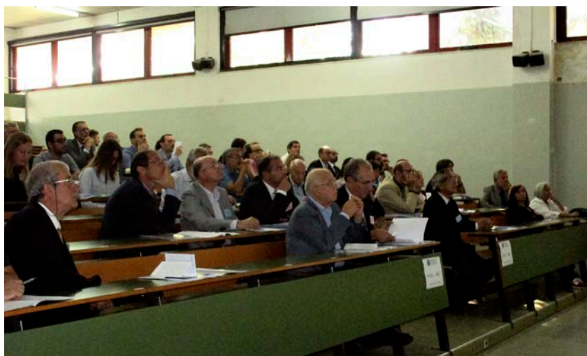
Fig. 3 - "Convegno del Ventennale" del Consorzio CINMPIS con la partecipazione del prof. Ei-ichi Negishi

A partire dal 2004, il CINMPIS assegna due tipologie di Premio annuali, l'uno per la "Innovazione nella Sintesi Organica" destinato ad un giovane ricercatore che abbia raggiunto risultati di alto valore scientifico in ricerche di sintesi organica, e l'altro per la "Migliore Tesi di Dottorato" in tematiche analoghe, consistenti in una targa d'argento ed una pergamena